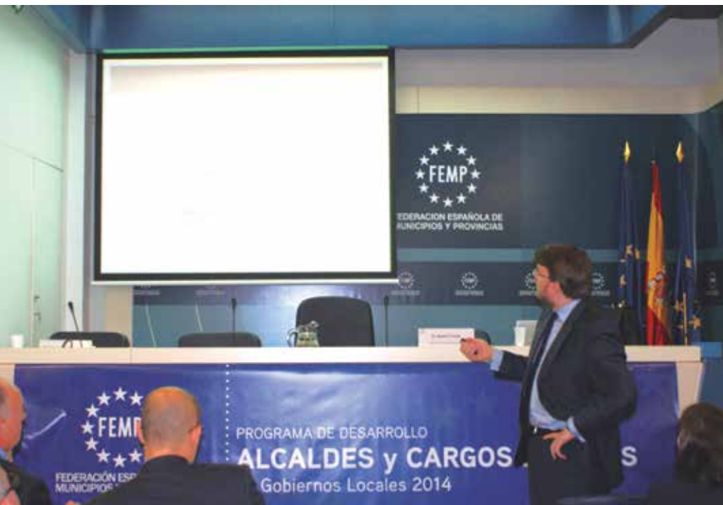
Seminario sobre Liderazgo político y comunicación, celebrado en la sede de la FEMP.

La creación del mensaje político y las claves para la redacción de discursos centraron la última parte del se-