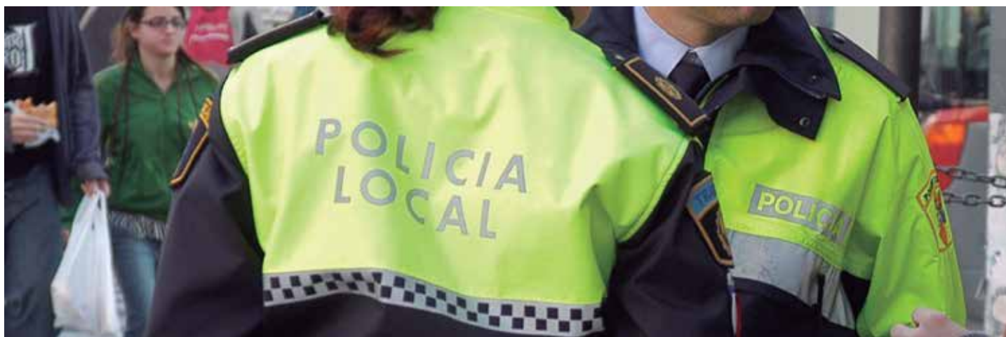
El Agente Tutor es un programa de la Policía Local, en colaboración con otros servicios municipales, que centra su actuación en el ámbito de la prevención y protección del menor

La acción preventiva es el arma más eficaz para enfrentarse al problema del consumo de drogas, sobre todo entre los más jóvenes, y el municipio es el lugar donde se puede desarrollar con mayor eficacia. Para ello, las Entidades Locales disponen de herramientas y de mecanismos como el Programa Agente Tutor, que la Delegación del Gobierno para el Plan Nacional sobre Drogas y la FEMP quieren extender al mayor número de Ayuntamientos posible.